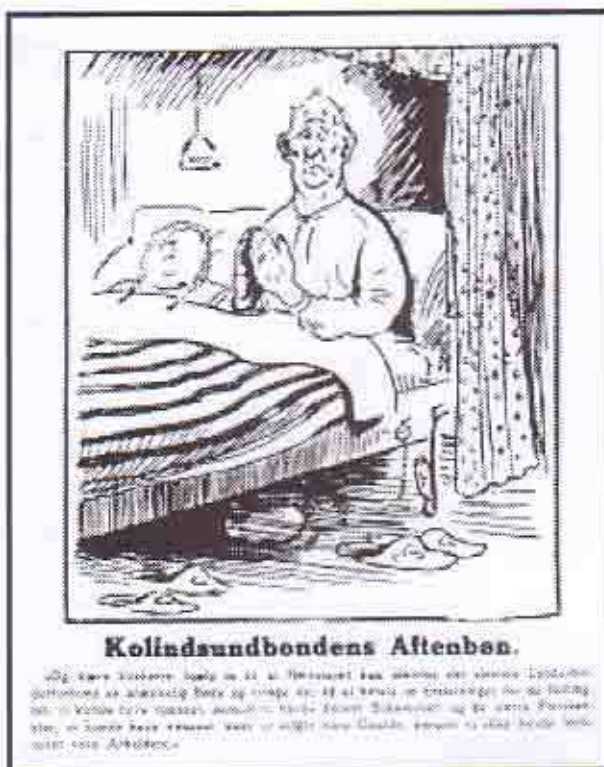
Landarbejderforbundets opfattelse af Kolindsundbønderne