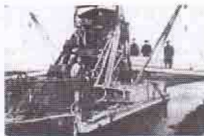
Muddermaskinen, omkring hvilken det hele startede i september 1923

Sidst på sommeren i 1923 gik Landarbejderforbundets ledelse aktivt ind i kampen for dels overenskomstordnede løn- og arbejdsforhold og dernæst forbedring af samme. Den opfordring tog den lokale fagforening i Kolindsund til sig. De gik ind i aktionen, og hermed startede en konflikt, som fik stor betydning i landarbejdernes kamp for organisationsret.